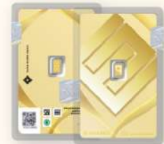
MICROGOLD 0.1 & 0.25 grams