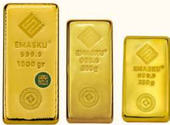
GOLDBAR 250, 500, 1000 grams

Meanwhile, for EMASKU® gold bars weighing 5-200 g, the BullionProtect® security feature is presented in the form of an HRTA engraving and Crown Logo, while for 0.5-2 g denominations, a Crown logo engraving is applied to the reverse side of the gold bar.