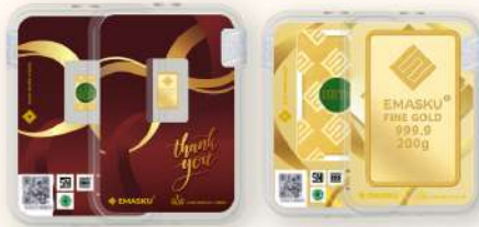
SMALLGOLD 0.5 - 200 grams