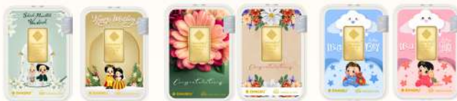
Happy Wedding Congratulations Baby Born All you Need Is Love Happy Birthday Thank You